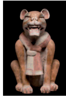
Jaguar , 100 av. J.C., Argile polychrome, 88,5x51x53cm, Museo Nacional de Anthropologia (Mexico), INAH-Canon