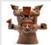
Dieu descendant de Dzibanché

2/ Curieux personnage à demi-couché, on posait les offrandes (cadeaux pour les dieux) et les sacrifices sur mon ventre pour les faire parvenir aux dieux.