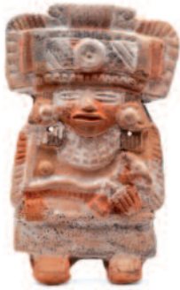
Figure féminine , Plateau central 650-900 ap J.C., Argile et pigments, Museo Nacional de Anthropologia (Mexico), INAH-Canon