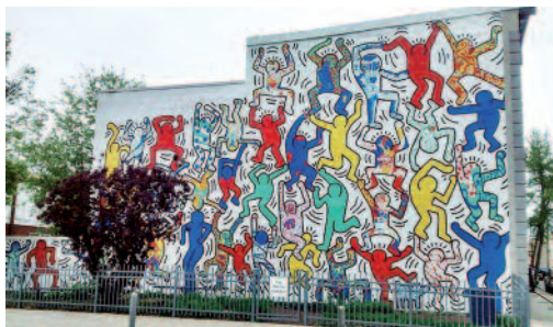
We are the Youth (Philadelphie), Keith Haring / Par Rgs25 (Travail personnel) [CC BY-SA 3.0( http://creativecommons.org/licenses/by-sa/3.0/ )], via Wikimedia Commons

Utilise tes crayons de couleur et un feutre noir pour les contours pour réaliser un dessin à la manière de Haring. Tu peux demander une feuille au médiateur.