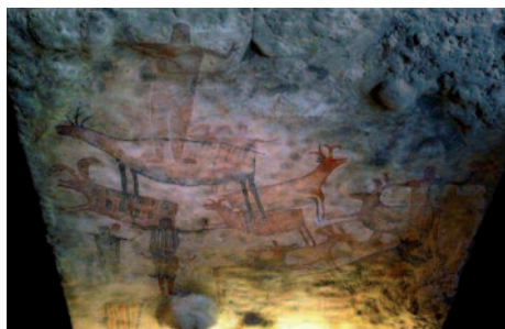
Peinture rupestre de La cueva del Ratón (Reproduction, Californie)

* La préhistoire est une période comprise entre l'apparition des premiers hommes et l'invention de l'écriture.