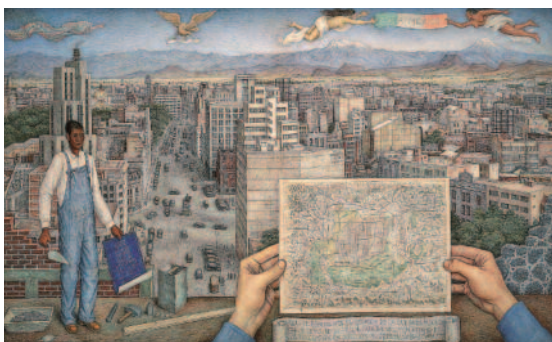
La ville de Mexico , Juan O'Gorman