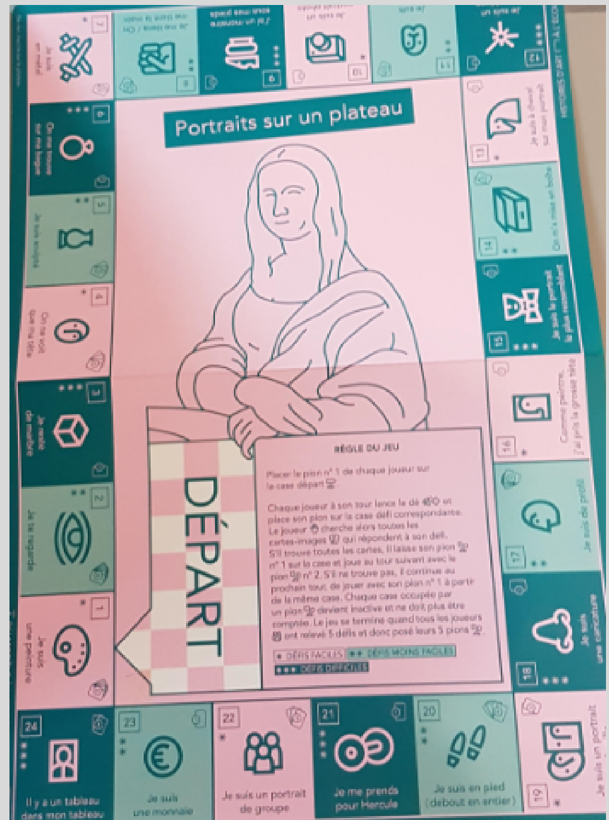
Plateau de jeu